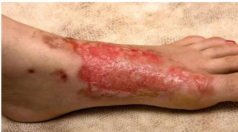
Figura 1 - Queimadura de terceiro grau com degeneração do tecido

A figura 1 mostra uma queimadura de grau três, com dificuldade de regeneração do tecido.