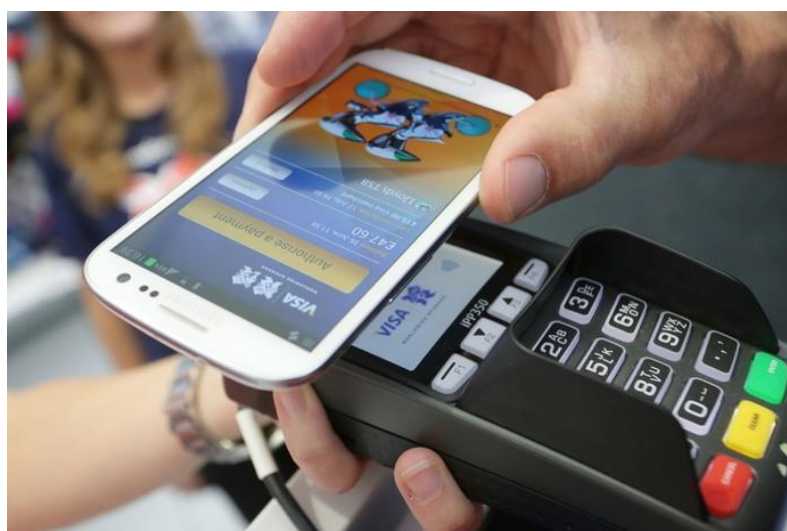
Figura 1 – Pagamento com dispositivo móvel

Em 2004 foi fundado o NFC FORUM, uma organização responsável pelas especificações de características e requisitos para desenvolvimento de aplicações baseadas nela. E tem como integrantes mais de 170 membros entre eles a Broadcom , Google , Intel Corporation , Mastercard Worldwide , Nokia , NXP Semiconductors , Qualcomm , Renesas Eletronics Corporation , Samsung Eletronics , Philips , Sony , Visa Inc . Essas são fabricantes, desenvolvedores de aplicativos e companhias de serviços financeiros. Com o propósito de promover o uso da tecnologia nos equipamentos eletrônicos e dispositivos móveis (NFC FORUM, 2013b).