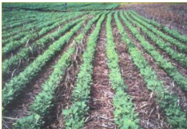
Figura 4: A Soja sobre palhada de cana-de-açúcar.

Os benefícios diretos de geração ao serem feitos no uso de leguminosa para a: fixação biológica de nitrogênio, da incorporação de matéria orgânica e na conservação do solo, resultando em reduzir o fertilizante na cana-planta (ROSSETTO e SANTIAGO, 2022).