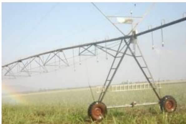
Figura 3: A irrigação por pivô central.