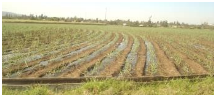
Figura 2: A irrigação por sulcos.

A irrigação de superfície: Aplica-se a água de forma concentrada nos sulcos de irrigação abertos de um jeito paralelo às fileiras das plantas (conforme a figura 2). Esse é o método que a baixa eficiência pela aplicação de água. Recomendado que apenas nas situações específicas de solos de textura, ao ser médio-argilosa e uma topografia plana (JUNIOR e RESENDE, 2022).