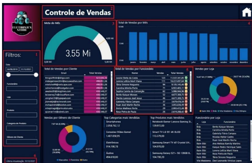
Imagem 5 – Detalhamento dos princípios aplicados na nova versão do dashboard .

Podemos notar que além do storytelling , agora, os princípios anteriormente discutidos estão sendo abrangidos.