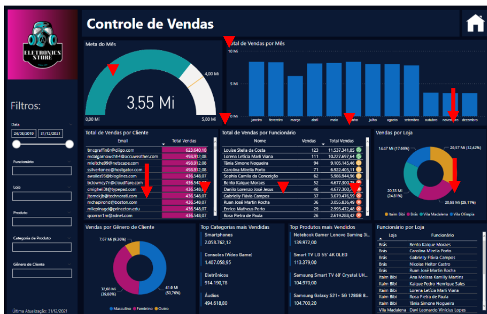
Imagem 4 – Leitura em formato ocidental: informações das mais para as menos importantes.

Com cores de acordo com a identidade visual da empresa, os novos indicadores foram adicionados seguindo uma leitura ocidental (imagem 4), visando dar prioridade visual das informações mais para as menos importantes, contando assim, uma narrativa com seus dados.