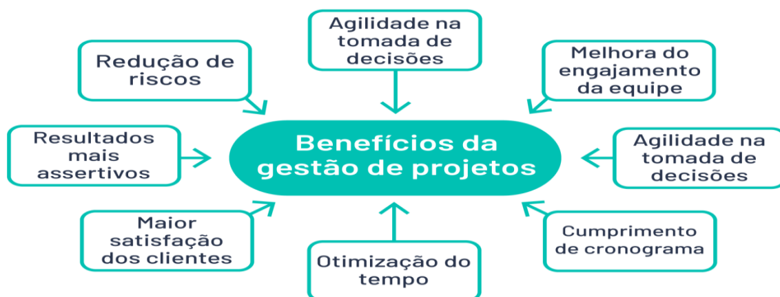
Figura 02: Benefícios da Gestão de Projetos

A figura 02 traz aspectos da importância da gestão de projetos