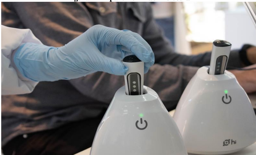
Figura 2 – Aparelho Hilab Molecular