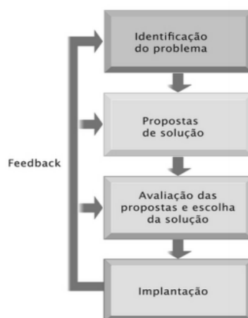
Figura 1 – Diagrama de proposta de implantação

Segundo Laudon e Laudon (2010) para desenvolver um sistema de informação é necessário compreender todos os tipos de problemas que ele deve resolver para criar uma solução para os processos organizacionais. Nesta pesquisa, gerenciar o uso dos equipamentos de uso compartilhado é o objetivo a ser organizado.