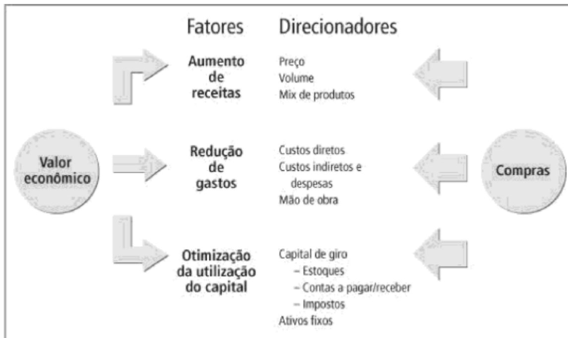
Figura 1 – Geração de valor